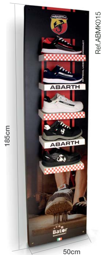
Expositor pared Abarth 5 posiciones Abarth shoes wall display 5 positions