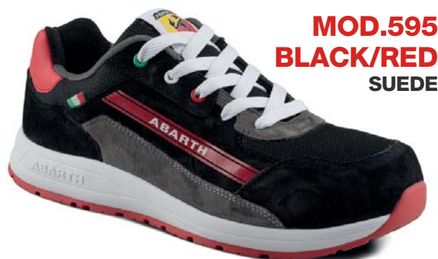
MOD.595 BLACK/RED SUEDE