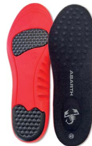
Gel Insole ABARTH +PLUS COMFORT

Tallas 36-39: Ref.ABAC002-36 Tallas 39-42: Ref.ABAC002-39 Tallas 42-45: Ref.ABAC002-42