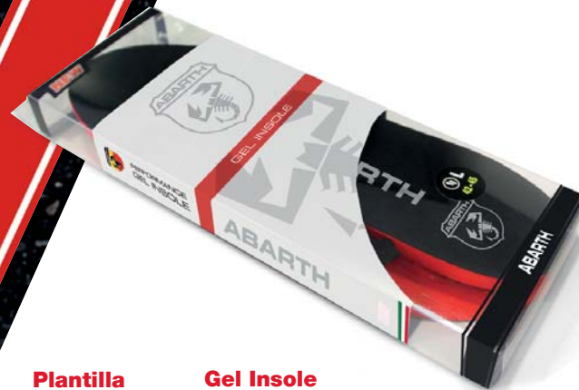
Plantilla de Gel ABARTH Performance