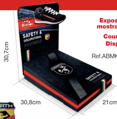
Expositor mostrador Counter Display