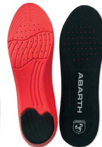
Gel Insole ABARTH Performance

Tallas 36-41: Ref.ABAC001-36 Tallas 42-47: Ref.ABAC001-42