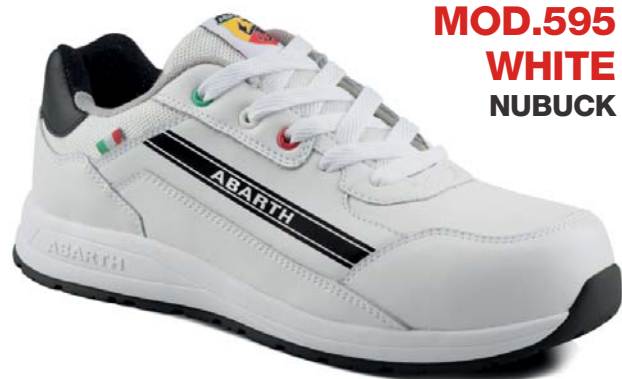
MOD.595 WHITE NUBUCK