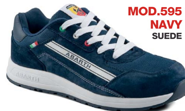
MOD.595 NAVY SUEDE