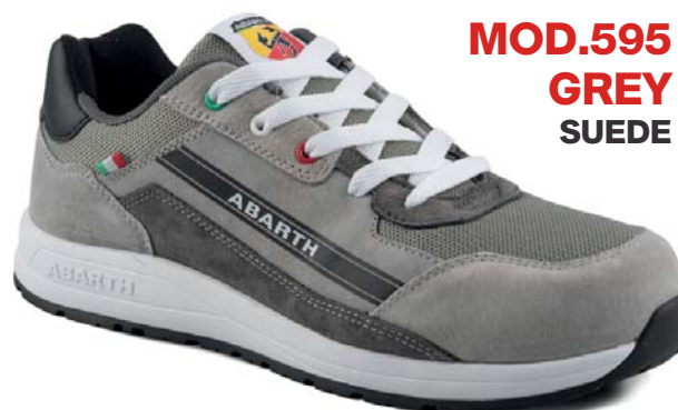
MOD.595 GREY SUEDE