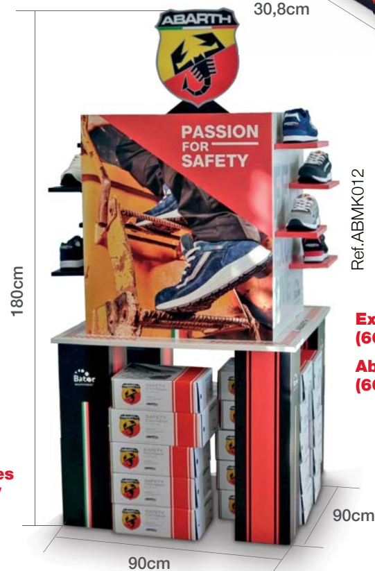
Expositor grande Abarth (60 zapatos) Abarth big display stand (60 shoes)